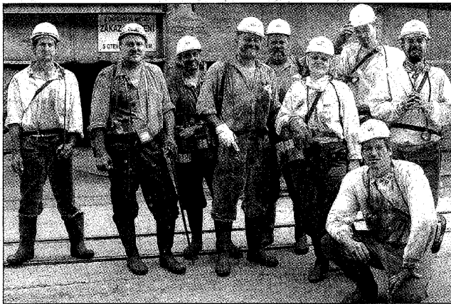
S výjimkou egyptského kolegy byli účastníci sochařského sympozia na šachtě ČSM Jih všichni.