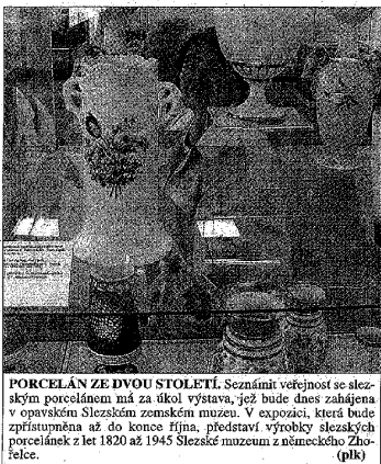
PORCELÁN ZE DVOU STOLETÍ. Seznámí veřejnost se slezským porcelánem má za účel výstava, jež bude dnes zahájena v opavském Slezském zemském muzeu. V expozici, která bude zpřístupněna až do konce října, představí výrobky slezských porcelánů z let 1820 až 1945 Slezské muzeum z německého Zhořelce. (plk)

story, které dlouhodobě postrádá. Rekl to ředitel galerie Jiří Jiža. Ostravská galerie výtvarného umění se podle něho dlouhodobě potýká s nedostatkem místa pro vystavení uměleckých šfrků. V depozitářích uchovává asi 25 000 exponátů, v sálech Domu umění jich ale může vystavit zhruba štvrtinu. (ČTK)